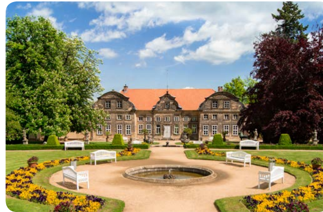
Das Kleine Schloss in Blankenburg, 2017,

10,00 € (Studenten/Rentner/Auszubildende)