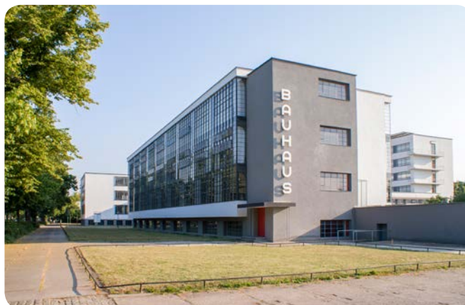
Das Bauhausgebäude, Gropiusallee 38

10,00 € (Studenten/Rentner/Auszubildende)