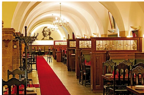
Ratskeller Magdeburg

(Eine Übersicht des Buffetangebotes ist unter www.archivtag.de zu finden, besondere Anmeldung erforderlich)