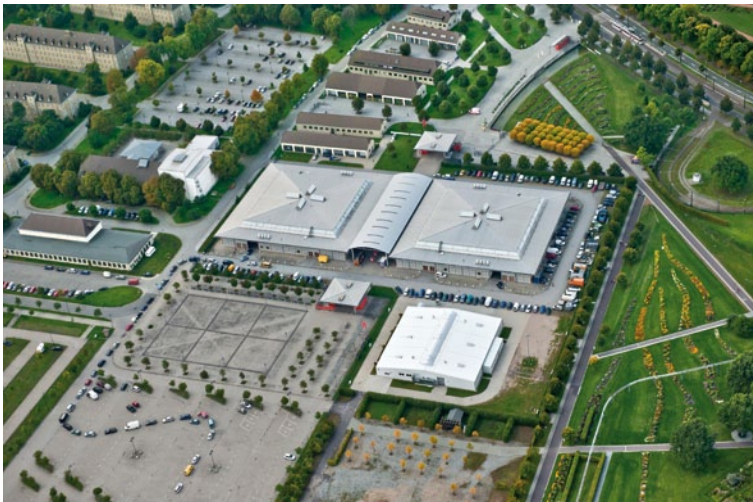
Ausstellungs- und Tagungszentrum der MESSE MAGDEBURG