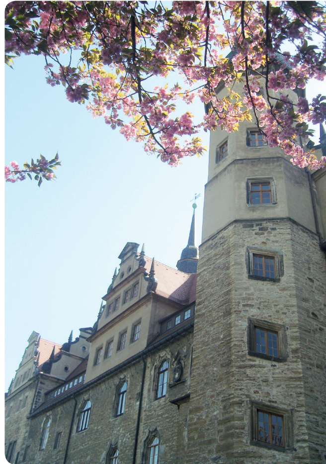
Schloss Merseburg, 24. April 2011.

VdA - Verband deutscher Archivarinnen und Archivare e. V. Landesverband Sachsen-Anhalt