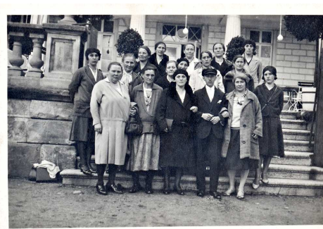
Frauengruppe der SPD Schmalkalden auf Fahrt nach Bad Salzungen (1930)

Besichtigung des Archivmagazins mit Sonderschau von Dokumenten zum Thema „Frauen in der Schmalkalder Geschichte“