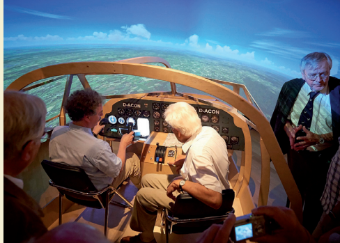
Flugsimulator der Focke-Wulf CONDOR.

Titelfotos: Mitglieder des deutschen Velocipedisten-Bundes um 1885. Linie 2 am Markt, 1960.