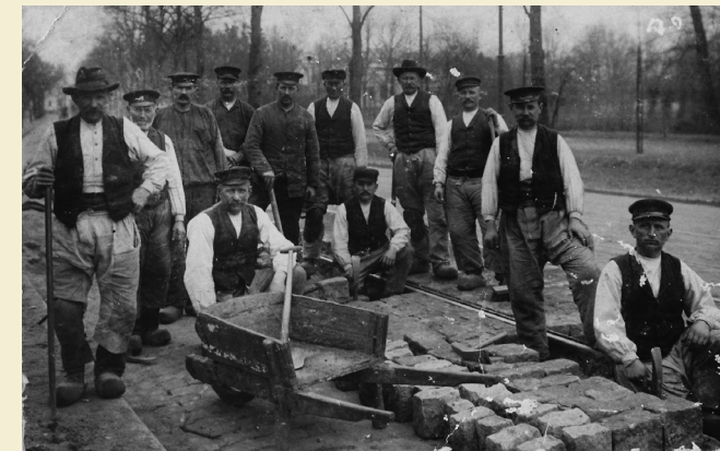
Die „Chausseeleute“ beim Setzen von Großpflaster um 1910.