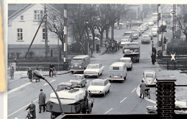
Bahnübergang an der Lemgoer Straße um 1960

Clara-Ernst-Platz 6 | 32791 Lage Tel.: 0 52 32 / 60 14 71 | E-Mail: stadtarchiv@lage.de