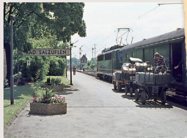
Expressgutverladung am Bahnhof Bad Salzuflen im Mai 1975

Gelbe Schule | Martin-Luther-Straße 2 | 32105 Bad Salzuflen Tel.: 0 52 22 / 95 29 20 | E-Mail: archiv@bad-salzuflen.de