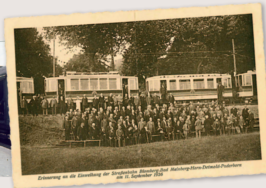
Postkarte zur Einweihung der Straßenbahnlinie, 1925

Im Siebenbürgen 1a | 32825 Blomberg Tel.: 0 52 35 / 5 02 45 03 und 0 52 35 / 50 41 35 E-Mail: d.zoremba@blomberg-lippe.de