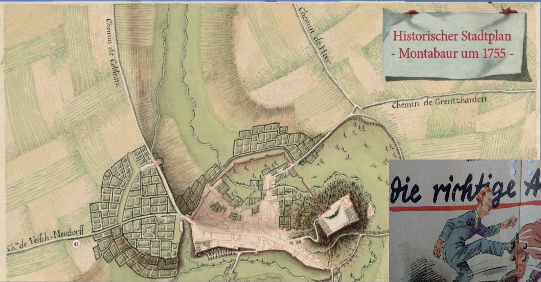
Historischer Stadtplan - Montabaur um 1755 -

VdA - Verband deutscher Archivarinnen und Archivare e.V.