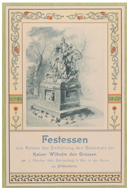
Menükarte: Festessen zur Denkmals- enthüllung am 31. Oktober 1900

Sie sind eingeladen, Neues zu entdecken, vielleicht Bekanntes wiederzufinden und darüber ins Gespräch zu kommen.