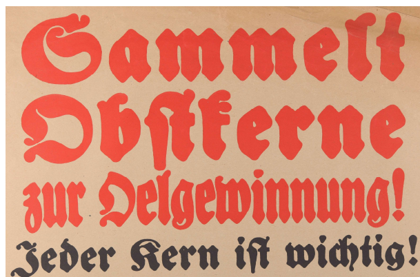
Plakat aus dem Ersten Weltkrieg: Aufruf des „Kriegsausschusses für Oele und Fette“ an die Hildesheimer Bevölkerung

Zum Motto des Archivtages zeigen wir eine Kabinettausstellung sowie eine digitale Bilderschau. Ein Bücherflohmarkt lädt zum Stöbern, ein kleines Café zum Verweilen ein.