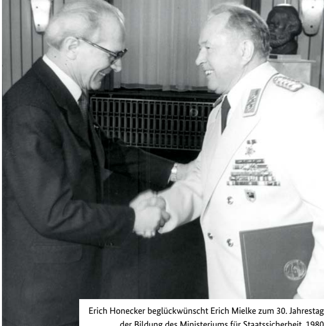
Erich Honecker beglückwünscht Erich Mielke zum 30. Jahrestag der Bildung des Ministeriums für Staatssicherheit, 1980