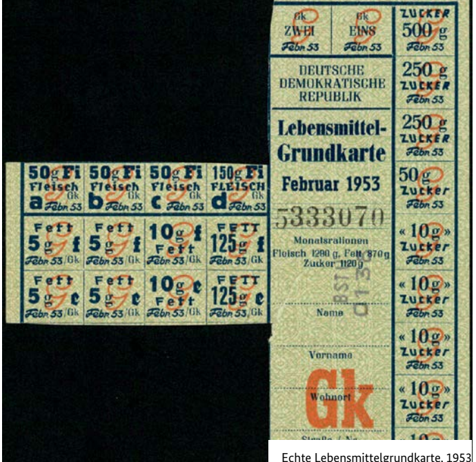
Echte Lebensmittelgrundkarte, 1953