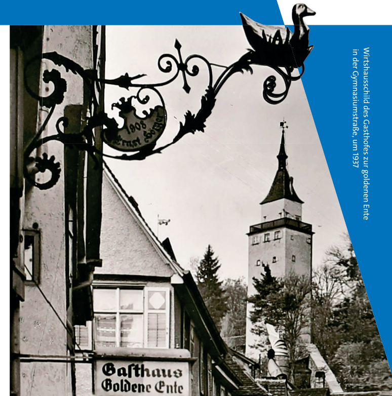
Wirtshauschild des Gasthofes zur goldenen Ente in der Gymnasiunstraße, um 1937