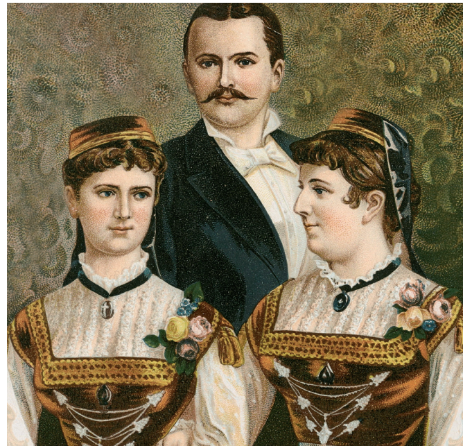
Die Geschwister Rommer, genannt die Schwäbischen Singvögel